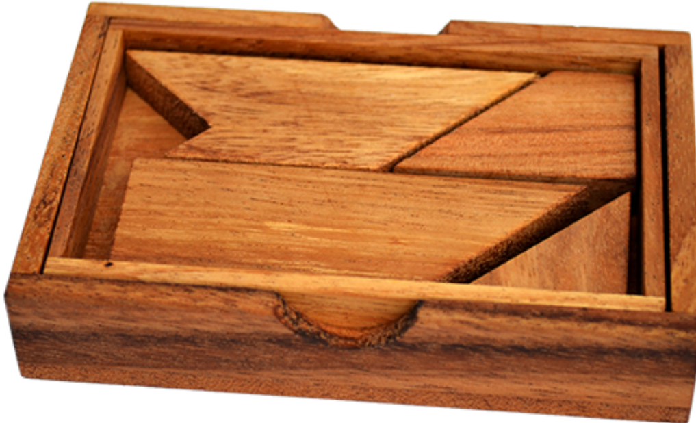
K Puzzle Box

Buchstaben K Holzpuzzle Wooden Game Tangram mit 5 Holzteilen in den Maßen 7,6 x 11,8 x 2,0 cm, samanea brain teaser