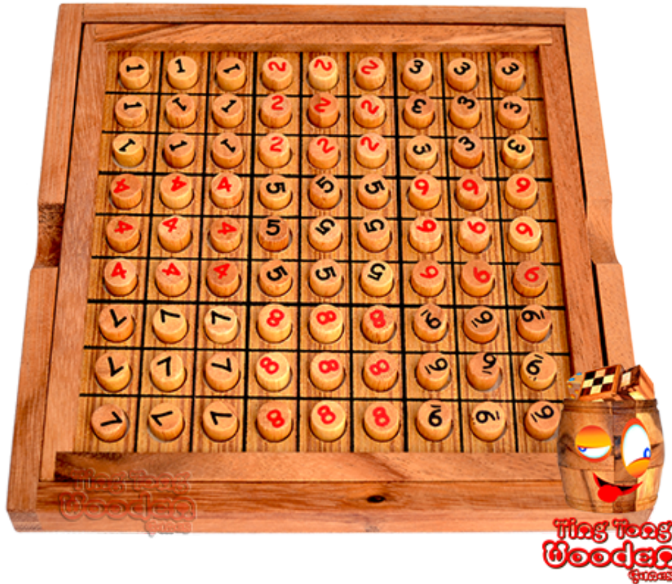
Sudoku 9x9 Board

mit Holzpins und in 2 Farben aufgedruckter Zahlen Maße 20,0 x 20,1 x 1,9 cm, sudoku board digit samanea wooden game