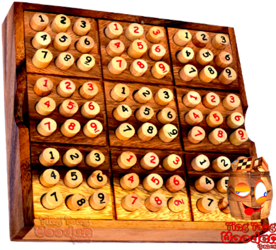
Sudoku 9x9 Box

mit Holzpins in 2 Farben und aufgedruckter Zahl mit Maßen 18,0 x 18,0 x 5,0 cm, sudoku digit samanea wooden game