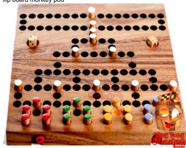
Barricade oder Malefiz mit Pins als Spielfiguren ... ein lustiges Würfelspiel mit Blockaden für die ganze Familie aus natur Samanea Holz als Klappbox mit Kugeln ... Preis: 28,00 €